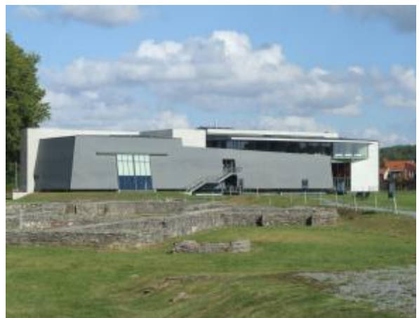
Provinciaal Erfgoed Centrum Ename