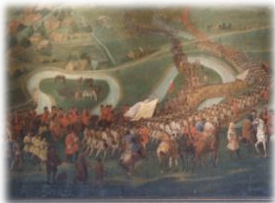
Slag bij Oudenaarde 11 juli 1708

Gelieve uw naam, aantal deelnemers, e-mailadres en gsm-nummer waarop u bereikbaar bent tijdens het bezoek op te geven, of in te vullen op het elektronisch inschrijvingsformulier van de website KOKW. Te betalen op rekening nr. IBAN: BE 50 8508 3519 1418 (BIC SPAABE22) van de KOKW. Betaling geldt als inschrijvingsvolgorde.