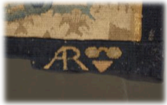
Unieke wandtapijten collectie van Oudenaarde

Kostprijs voor de leden: 49 euro per persoon (één drank tijdens het middagmaal is inbegrepen). Max. 50 deelnemers.