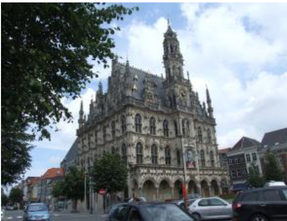
Markt en Stadhuis Oudenaarde