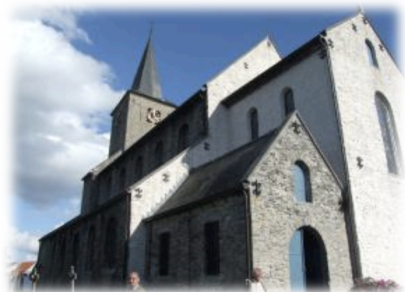
Kerk van Ename